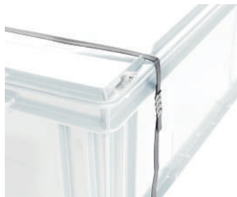
Abertura para agregar zuncho.