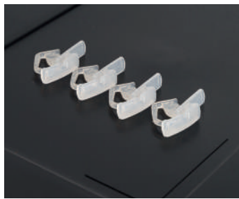
Capacidad de incorporar clips para asegurar las tapas a los contenedores.