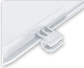
Sistema de bisagras de fácil instalación en los contenedores.